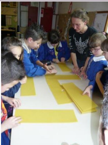
Ed ora... tutti al lavoro!