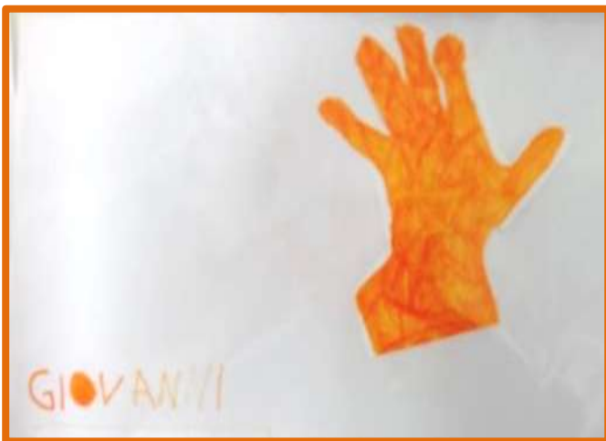
ORANGE HAND (mano arancione)