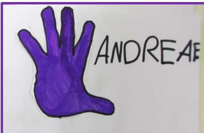
PURPLE HAND (mano viola)