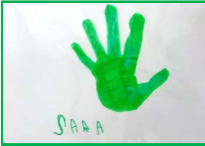
GREEN HAND (mano verde)