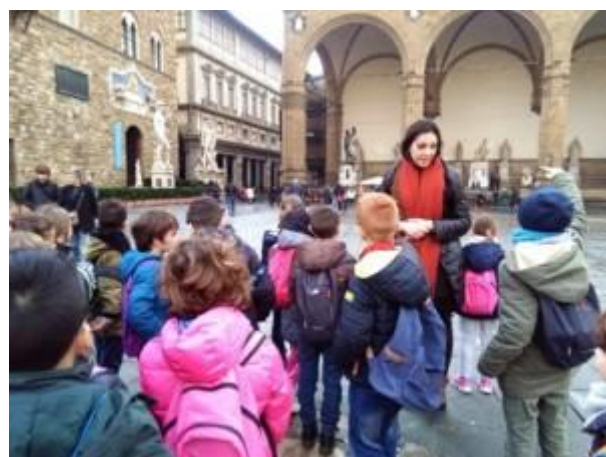
Piazza della Signoria e Palazzo Vecchio