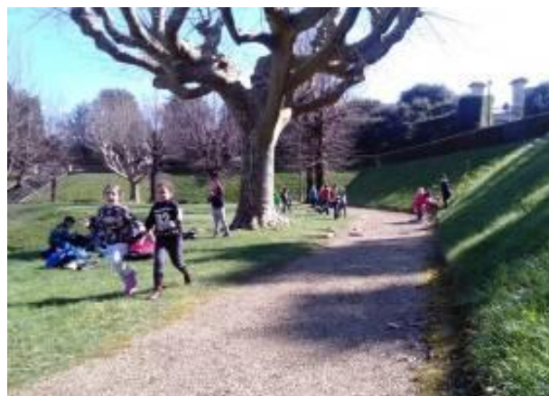
Giardino di Boboli