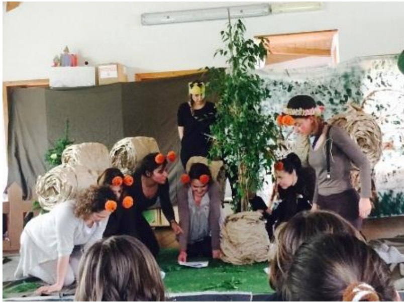
Ribelle discute con le altre lumache se proseguire nel viaggio.