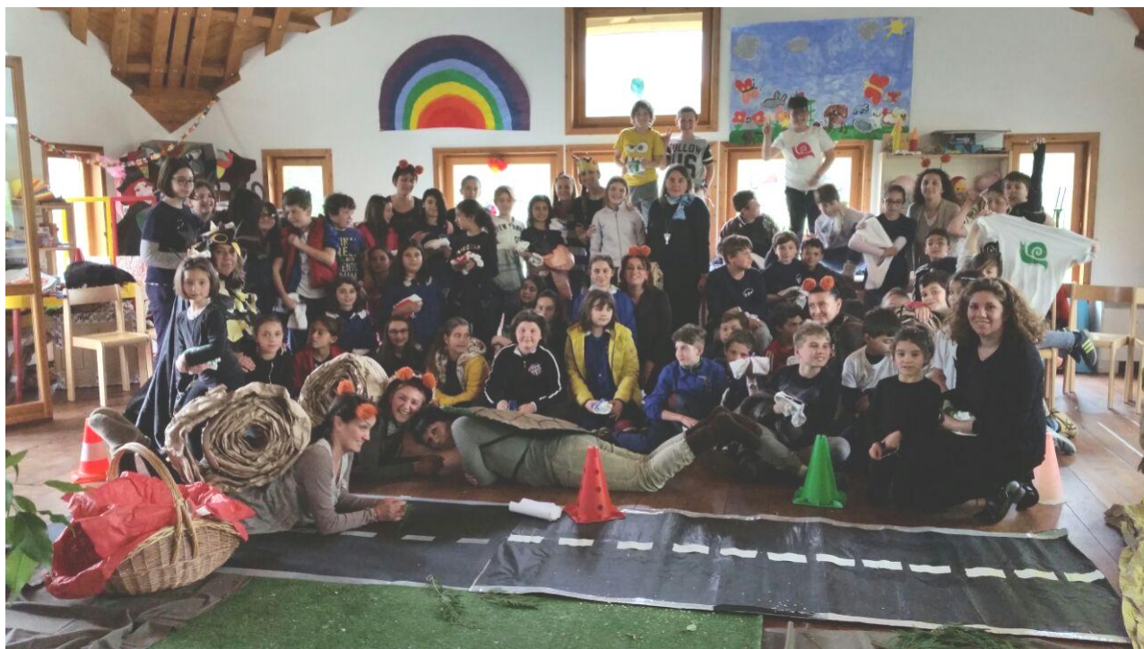
I ragazzi delle classe quinta insieme agli “attori”

“ In questo viaggio che è iniziato quando ho voluto avere un nome ho imparato tante cose. Ho imparato l'importanza della lentezza e, adesso, ho imparato che il paese del Dente di Leone, a forza di desiderarlo era dentro di noi”.