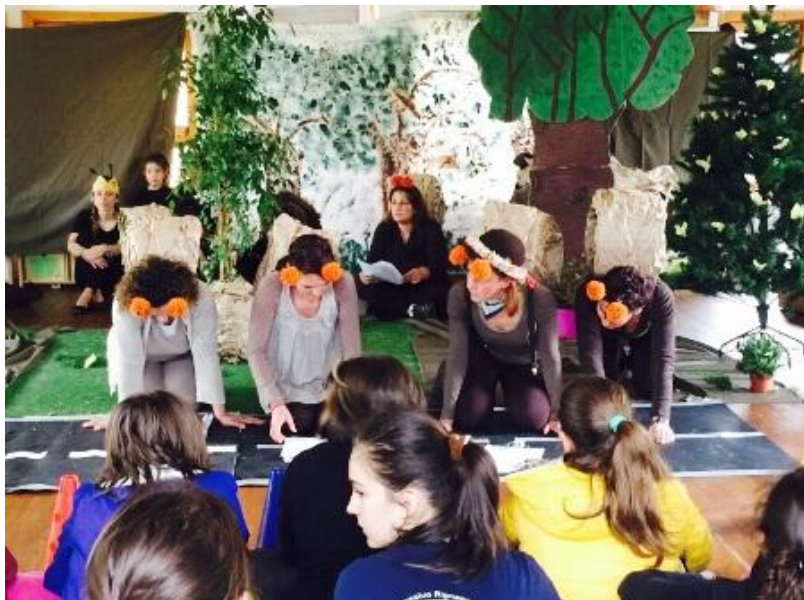
Le lumache giungono felici nel nuovo Paese del Dente di Leone.